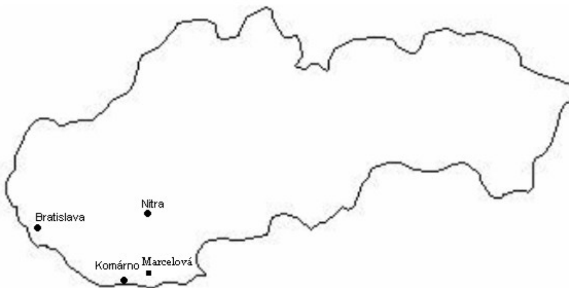
Mapa 1: Poloha obce Marcelová na Slovensku vo vzťahu k hlavnému mestu, krajskému centru a obvodnému/okresnému mestu